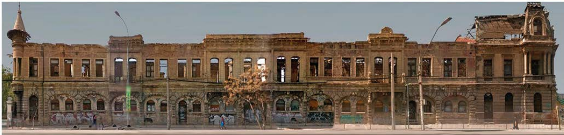
Antes y después, restauración de fachada cervecería Ebner.