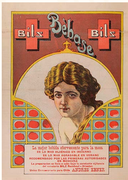
Publicidad Bilz. Revista La Lira Chilena , mayo de 1904.