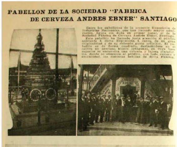
Pabellón de la Ebner en Quinta Normal. Revista Zig-Zag , diciembre de 1910.