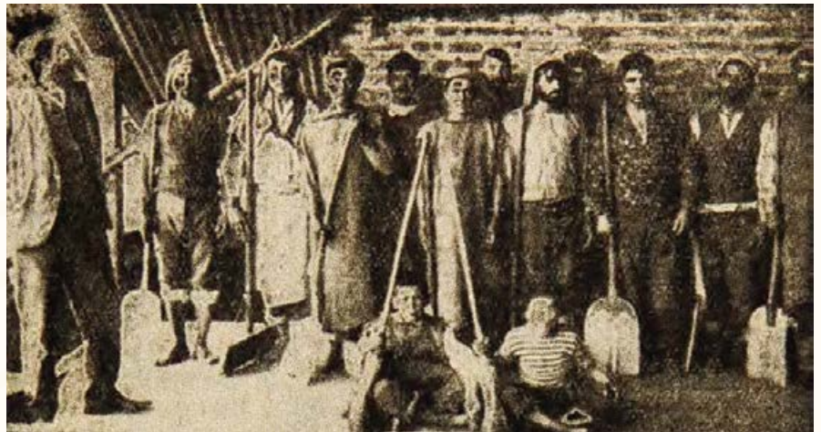
Trabajadores cervecería Ebner. El Obrero Ilustrado , julio de 1906.