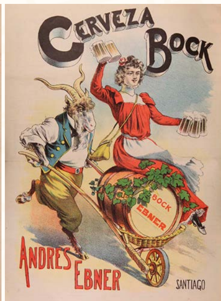
Publicidad cerveza Bock. Revista La Lira Chilena , mayo de 1904.