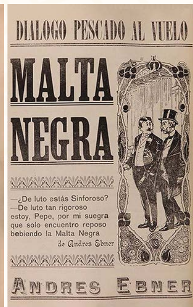
Publicidad Malta Negra, Andrés Ebner. En Pinterest Publicidad gráfica retro