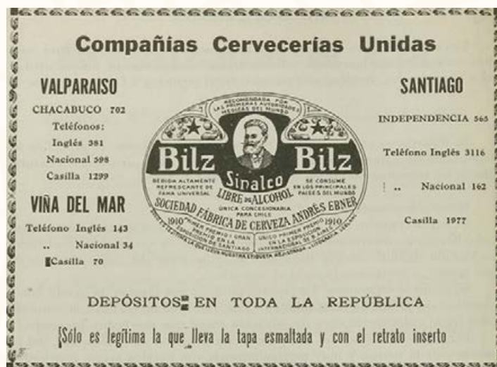
Fábrica de cerveza Independencia. Imprenta Barcelona, Santiago a la vista , 1913.