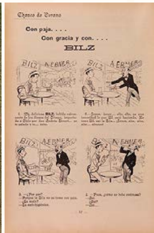
Caricatura Bilz. Revista La Lira Chilena , diciembre de 1906.