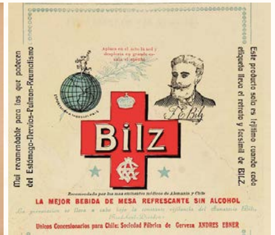
Recorte publicitario. Revista Corre Vuela , enero de 1908.