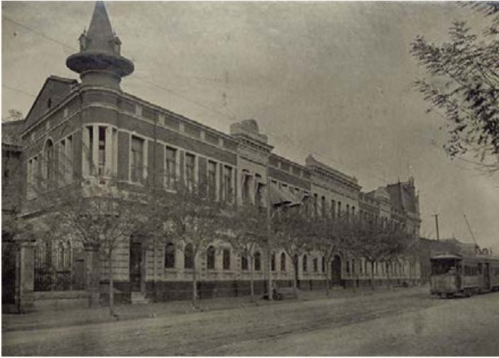
Cervecías Unidas-Independencia.