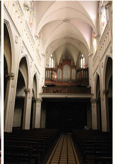
Vista de una de las naves laterales de la iglesia.