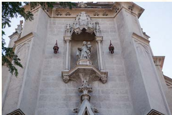
Detalle fachada Iglesia de los Carmelitas.