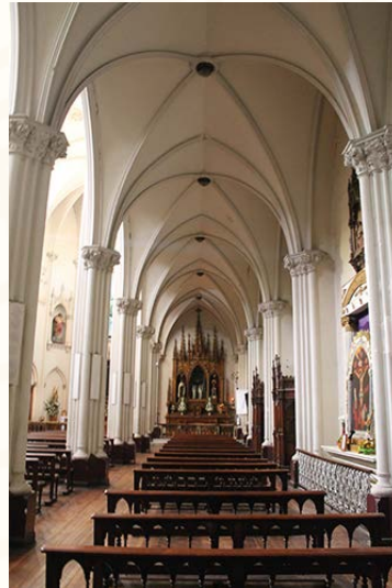
Vista de una de las naves laterales de la iglesia. Fotografía de Loreto Vergara Gálvez, en Arquitectura Patrimonial de Independencia , 2018.