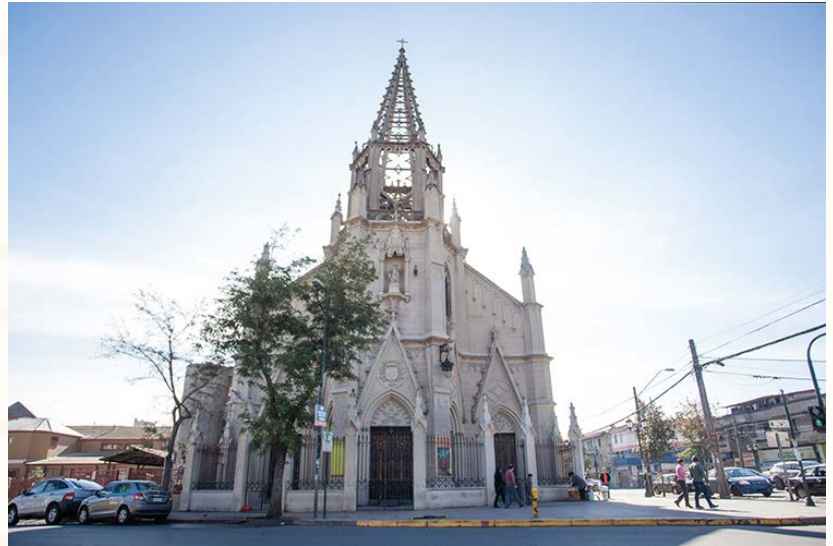
Iglesia del Milagroso Niño Jesús de Praga. Fotografía de Loreto Vergara Gálvez, 2018. Archivo Corporación de Cultura y Patrimonio de Independencia.