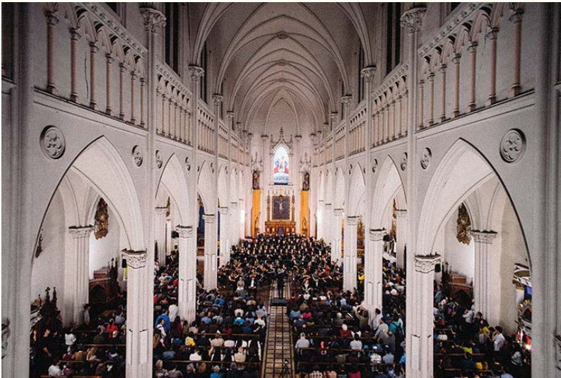
Concierto Orquesta Universidad de Santiago.