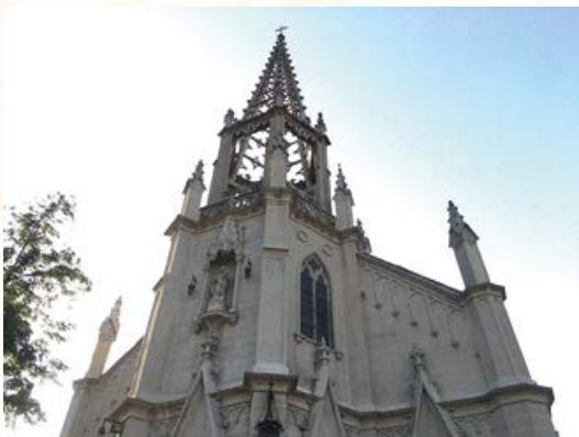
Torre de inspiración gótica que culmina en aguja.