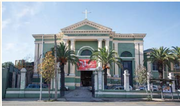
Parroquia La Estampa, 2016.