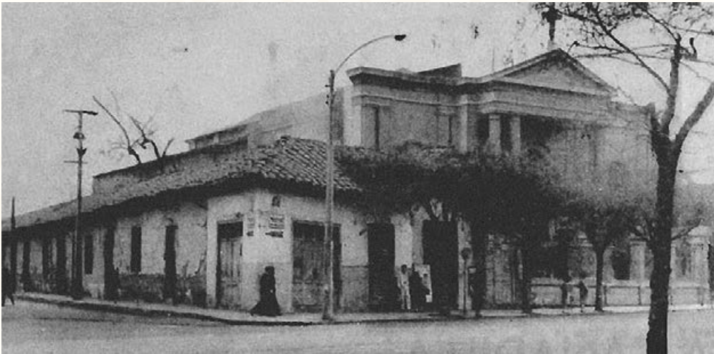
Parroquia La Estampa Volada. Revista En Viaje , julio de 1963.