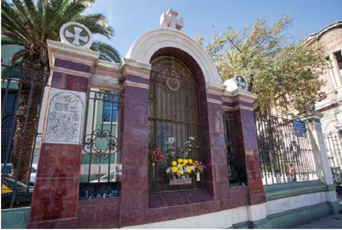
Parroquia de La Estampa Volada de Nuestra Señora del Carmen. Fotografía de Loreto Vergara Gálvez, 2018. Archivo Corporación de Cultura y Patrimonio de Independencia.