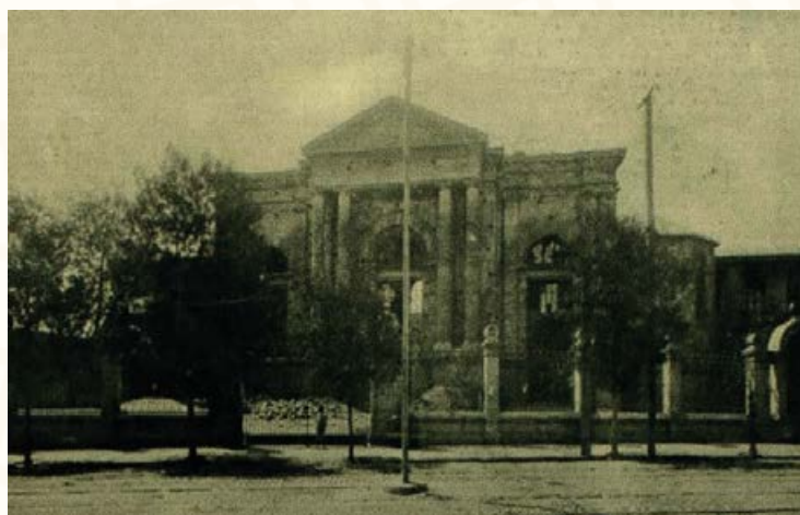
Iglesia La Estampa. Revista Zig-Zag , octubre de 1907.