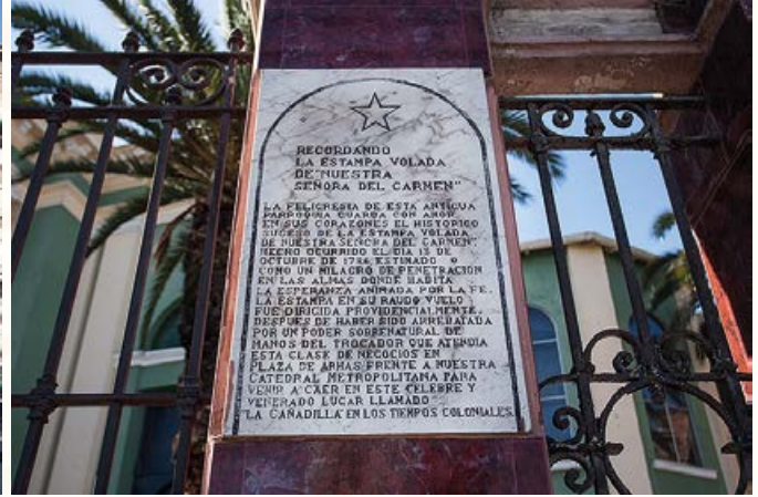
Parroquia de La Estampa Volada de Nuestra Señora del Carmen.