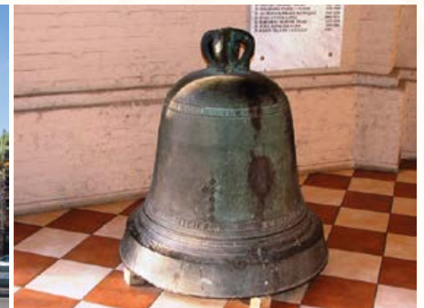
Campana de la Iglesia de La Estampa. Blog Chile Iglesias Católicas.