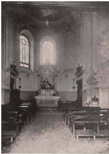
Virgen del Carmen. Aníbal Escobar ed., Album de Arquitectura de la Universidad Católica de Chile , 1924.