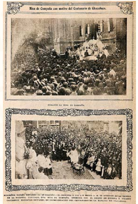
Misa de campaña para el Centenario de Chacabuco. Revista Sucesos , febrero de 1917.