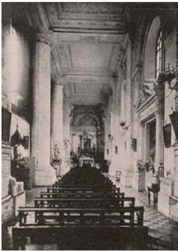
Interior Iglesia La Estampa. Aníbal Escobar ed., Album de Arquitectura de la Universidad Católica de Chile , 1924