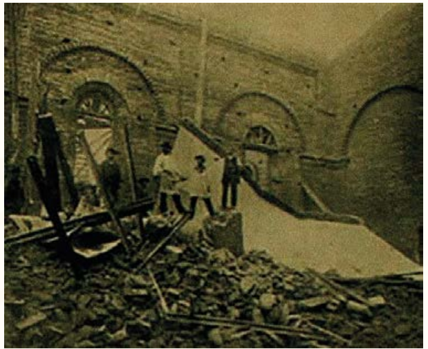
Iglesia La Estampa tras terremoto de 1828. Revista Zig-Zag , julio de 1906.