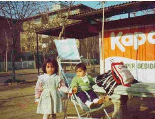
Niños en kiosco calle Gamero. Quiero Mi Barrio, Población Juan Antonio Ríos 2C, una aproximación a su historia y vida cotidiana , 2010. Catálogo Minvu.