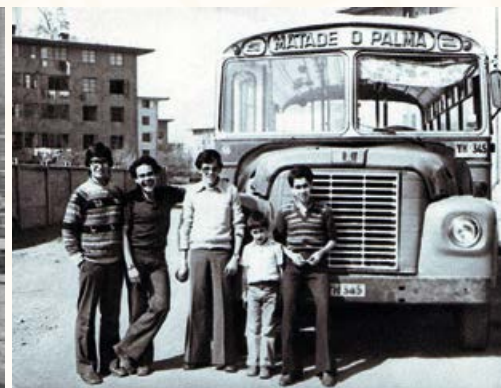
Matadero Palma en Población.