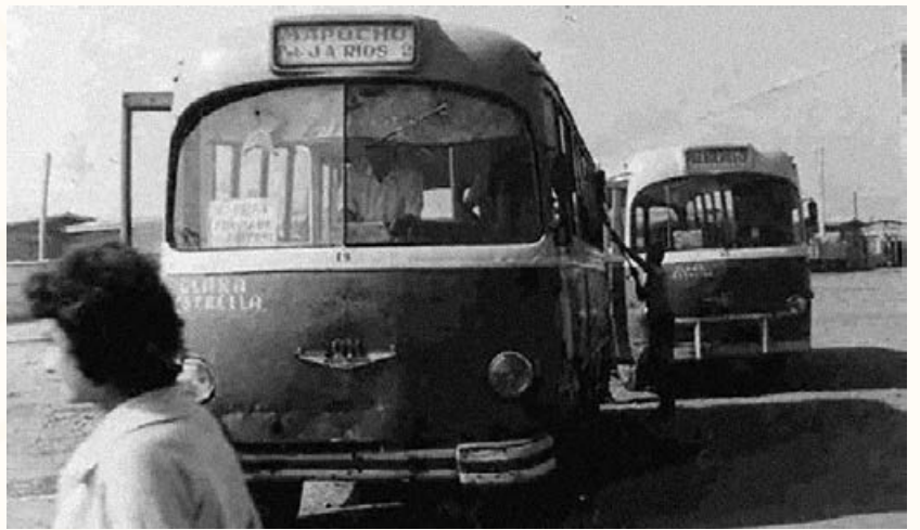
Micro. Quiero Mi Barrio, Población Juan Antonio Ríos 2C, una aproximación a su historia y vida cotidiana , 2010. Catálogo Minvu.