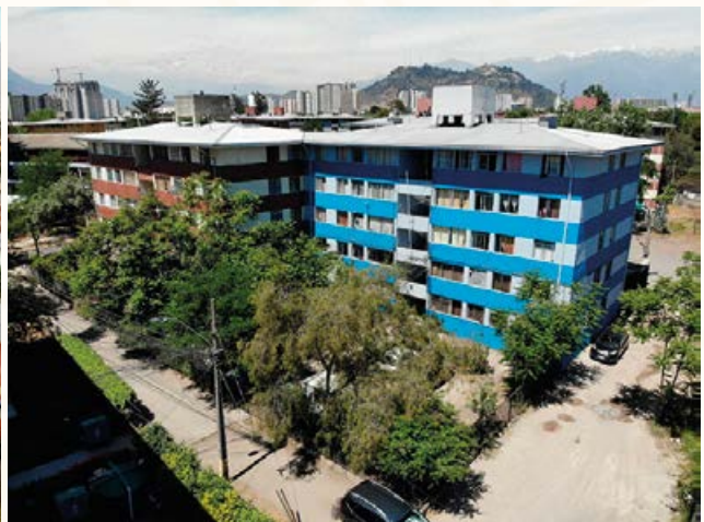
Blocks Población Juan Antonio Ríos.