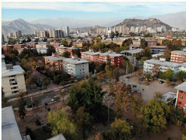
Vista aérea Población Juan Antonio Ríos.