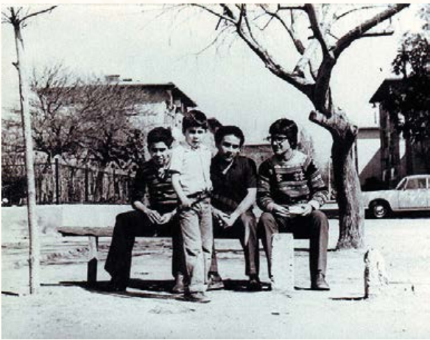
Población Juan Antonio Ríos. Blog Identidad y cultura. Autor y año desconocido.