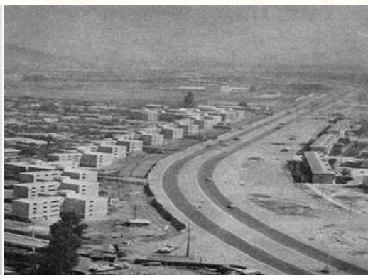
Bloques del sector 2B, sector fundacional y carretera antes de su remodelación . Beatriz Aguirre, Salim Rabí, La trayectoria espacial de la corporación de la Vivienda(CORVI), 2009. Universidad Central.